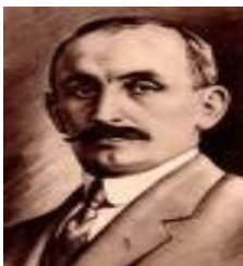
Andon Zako Çajupi

Veprat “Baba Tomori” dhe komedinë “Katërmbdhjetë vjeç dhëndër” i ka shkruar Çajupi.