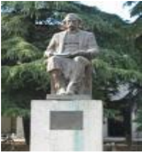
Përmendorja e Kristoforidhit në Elbasan