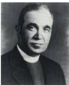
Fan Noli 1882 - 1965

“Album”, “Historia e Skënderbeut”, “Autobiografia”, “Izraelit e Filistin”, “Betoveni dhe Revolucioni francez”.