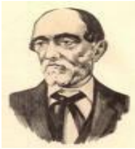
Jeronim De Rada

Nismëtar i Romantizmit në letërsinë tonë konsiderohet Jeronim De Rada me veprën e tij romantike “Këngët e Milosaos”. U lind në vitin 1814. Studioj letërsi antike e moderne në Itali. Ishte i ndikuar nga idetë e Revolucionit Francez. Shkroi veprat: “Këngët e Milosaos”, “Serafina Topia”, “Parimete e estetikës”, “Lashtësia e kombit shqiptar”, “Rapsodi të një poeme arbreshe”, “Skënderbeu i pafat” etj. Vdiq në vitin 1903 në moshë nëntëdhjetëvjeçare, në një dhomë të shkretë, pa dritë, pa bukë, pa zjarr duke lënë pas pikëllimin e gjithanshëm të arbëreshëve.