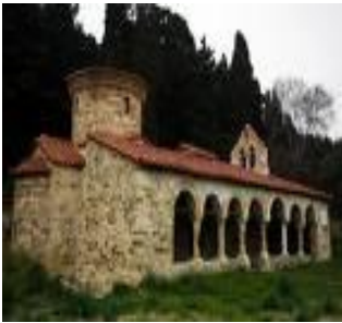
Pamje nga Voskopoja

Në shekullin e XVIII qendër shumë e rëndësishme arsimore e kulturore në jugun e Europës ishte Voskopoja. Voskopoja shtrihet 13 km në perëndim të Korçës. Kishte shtypshkronjën e vet që ishte e para në Ballkan dhe Bibliotekën e njohur. Në vitin 1720 u themelua shkolla e mesme e quajtur “Akademia e Re” në të cilën jepnin mësim Teodor Kavaljoti, Anonimi i Elbasanit, Dhaskal Todri etj. Voskopoja ishte edhe qendër e artit pamor. Aty pikturuan Kostantin e Athanas Zografi, Thedhor Sino veprat e të cilit janë gjetur edhe në Hungari, Slloveni, Serbi, Austri etj. Në Voskopoje u përkthyen në shqip Ezopi dhe shumë libra fetare.