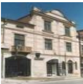
Ndërtesa ku u mbajt Kongresi i Manastirit

Kongresi i Alfabetit të gjuhës shqipe u mbajt më 14 - 22 nëntor 1908 në Manastir. Morën pjesë 150 delegatë nga qytete të ndryshme dhe nga klube e shoqëri patriotike brenda e jashtë vendit. Në mesin e delegatëve ishin edhe: Luigj Gurakuqi, Mithat Frashëri, Gjergj Fishta, Gjergj Qiriazi etj. Në këtë Kongres u vendos që shqipja jonë të përdorë alfabetin latin. Kryetar i Kongresit u zgjodh Gjergj Fishta kurse sekretare u zgjodh Parashqevi Qiriazi. Në Manastir filloi punën edhe shtypshkronja që pati rëndësi të veçantë për botimin e librave shkollor. Në këtë qytet u formua edhe Klubi i Manastirit që tuboi shumë intelektualë e patriotë shqiptarë.