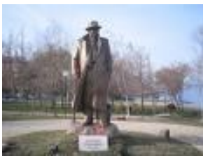
Shtatorja e Lasgush Poradecit