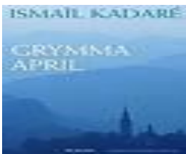
Ballina e romanit ”Prilli i thyer” në suedisht

Vepra e fundit e Ismail Kadaresë përkthyer në suedisht titullohet “Grymnia april”. Vepra është përkthyer nga frëngjishtja në suedisht ndërsa romani në shqip titullohet “Prilli i thyer”. Edhe kjo vepër është botuar nga shtëpia botuese me famë në Suedi Albert Bonniers Förlag dhe vepra është mirëpritur e shoqëruar me kritika të shumta afirmative.