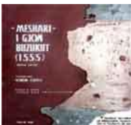
Meshari – libri më i vjetër shqip