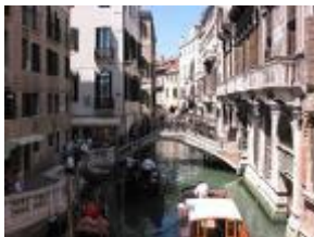
Pamje nga Venediku

31. Sot, shkolla shqipe funksionon mirë edhe jashtë atdheut. Dëshmi e gjallë është edhe ky kuiz i sotëm këtu në Suedi. Por, pesëqind vjet më parë ishte Marin Beçikemi që hapi shkollën e parë jashtë atdheut. Në cilin qytet të Italisë u hap kjo shkollë?