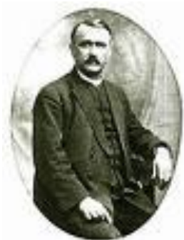
Gjergj Fishta 1871 - 1940