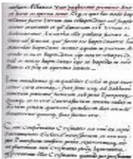
Formula e pagëzimit

Dokument i më i hershëm i shqipes së shkruar është “ Formula e pagëzimit” e vitit 1462. Formula është gjetur në bibliotekën Laurentiana të Milanos nga albanologu rumun Nikolla Jorgo në vitin 1915.